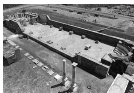
SINAGOGA DI SARDIS Turchia | II-III secolo