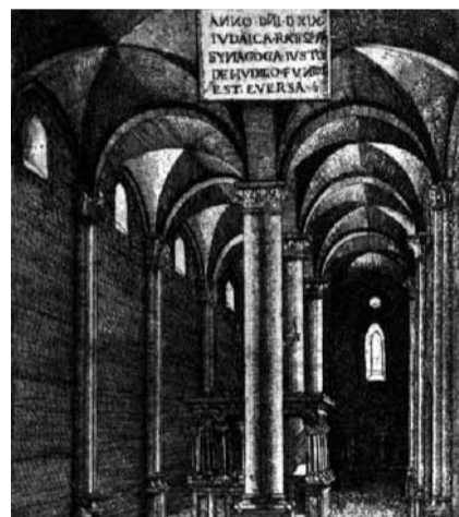
Sinagoga di Ratisbona con la Bema tra le colonne, in un'incisione di A. Altdorfer (1519).