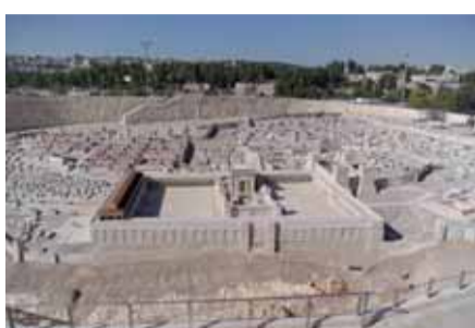
Modello del Secondo Tempio di Gerusalemme.