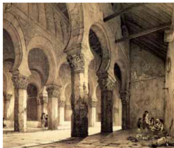
Santa Maria La Blanca, già Sinagoga di Toledo, in una litografia intorno al 1840.