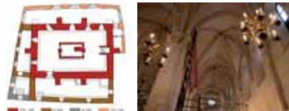
SINAGOGA DI PRAGA XIII secolo

Coordinamento: Nicola De Mari | Consulenza: Siciliano Levi Della Torre | Progetto: Studio grafico Andrea Musso